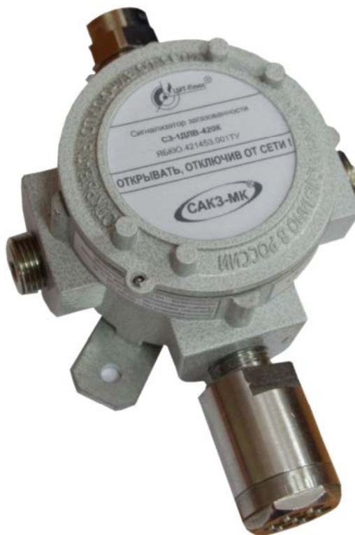
Рисунок 1 - Общий вид сигнализаторов загазованности природным газом СЗ-1ДЛВ-420К